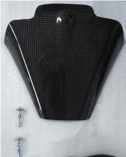
Foto con Materiale di Fornitura